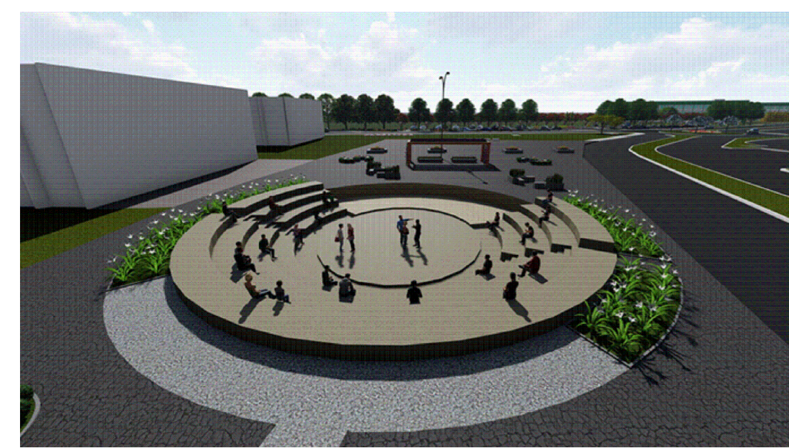
21 VISTA ANFITEATRO DE ARENA Esc. S/E